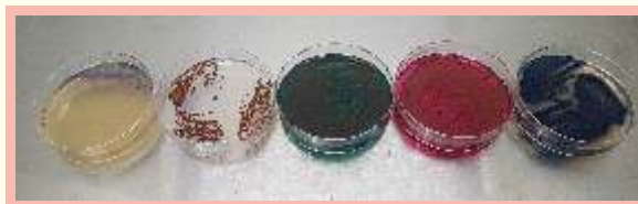
Los 5 patógenos más típicos en cosmética

Además del base, incluye los 5 patógenos cosméticos más típicos tras enriquecimiento: